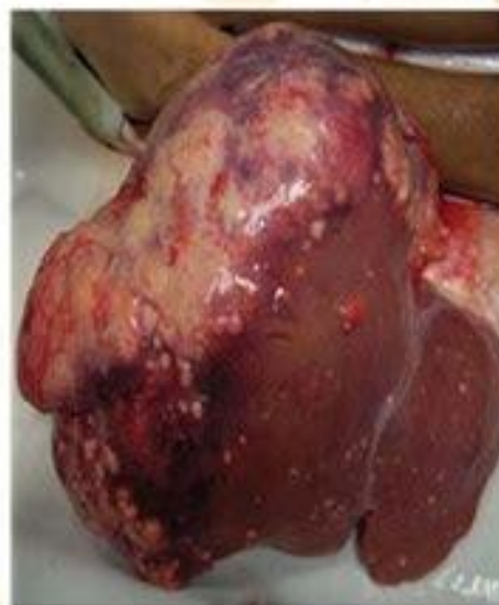
Figura 1 Macroscopia Hígado: Masa tumoral irregular infiltrante, dependiente de lóbulo derecho del hígado, que comprime 80% de masa hepática y comprime lóbulo izquierdo, con peso de 4 500 gramos.